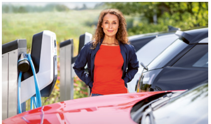
AMTRON® Professional+ sur pilier en inox