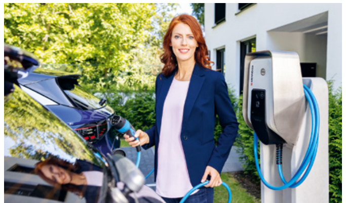
AMTRON® Professional+ sur pilier en béton