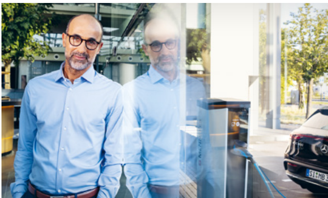
Borne de recharge AMEDIO® Professional+