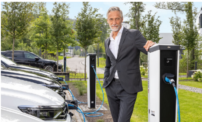
Borne de recharge AMEDIO® Professional+