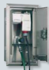
Inbouwcombinaties voor stroom- en wateraansluiting