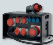
EverBOX® – mobiele verdelers