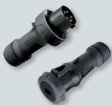
CEE-contactstoppen en koppelcontactstoppen