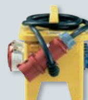
EverBOX® – mobiele verdelers