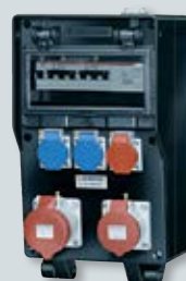
MENNEKES EverGUM contactdooscombinaties