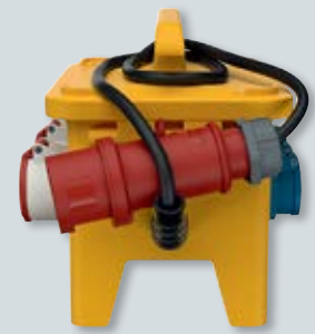
3 Mobiele EverGUM verdeler