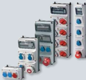
1 AMAXX® contactdooscombinaties