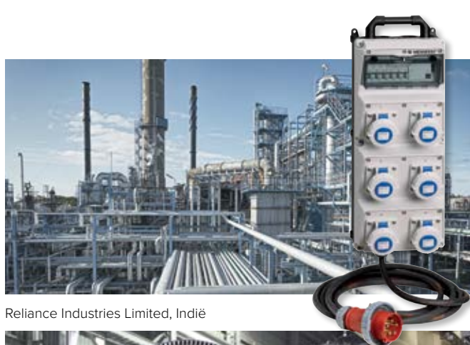
Reliance Industries Limited, Indië