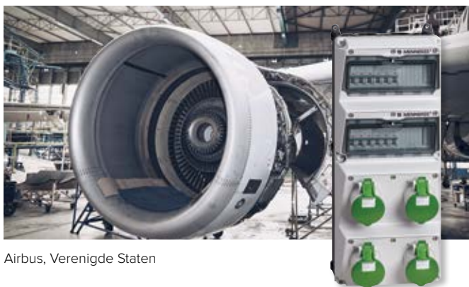
Airbus, Verenigde Staten