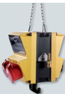
1 AMAXX® op te hangen