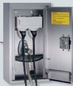
2 Roestvrij stalen verdeler