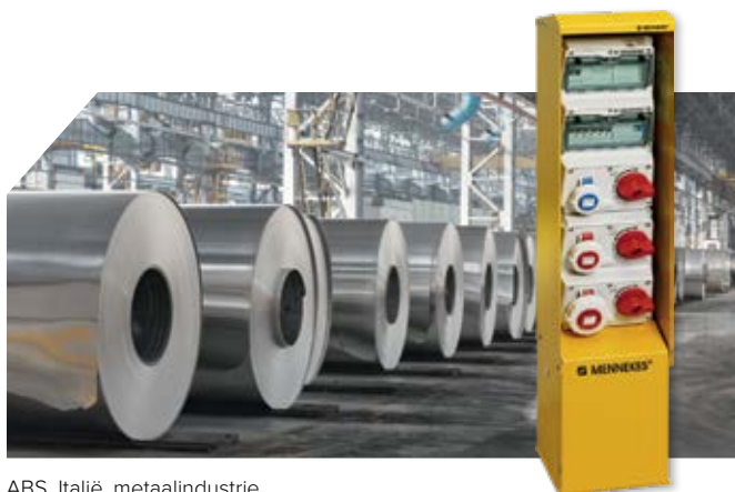
ABS, Italië, metaalindustrie

mogelijke combinaties biedt en onze passie, klantspecifieke oplossingen tot een geheel te ontwikkelen – en dat voor wereldwijd gebruik.