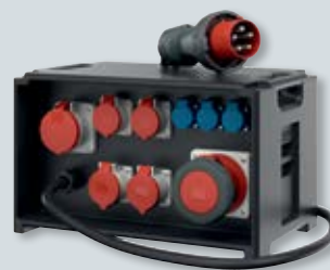
2 EverBOX® – mobiele verdeler