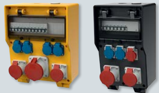
3 EverGUM contactdooscombinaties