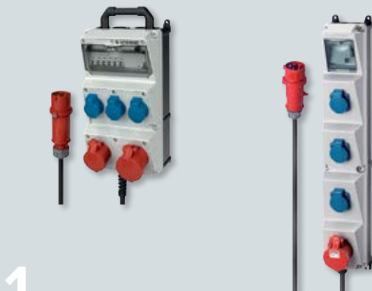
1 AMAXX® combinatie